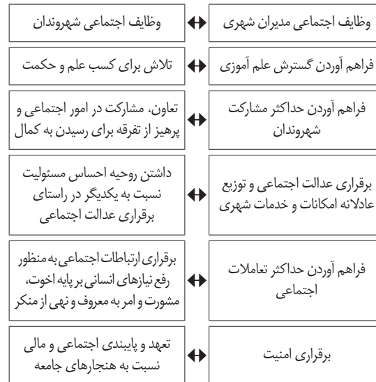
شکل ۳. وظایف اجتماعی مدیران شهری و شهروندان از منظر قرآن کریم.

روش تحقیق، کیفی از نوع تحلیل محتوا است. در این پژوهش سعی گردیده از محتوای آشکار یعنی بهره‌گیری مستقیم از آیات و نیز از محتوای پنهان که شامل متن تفسیر میزان است، استفاده شود. همچنین از نرم‌افزار ATLAS-ti برای تحلیل متن