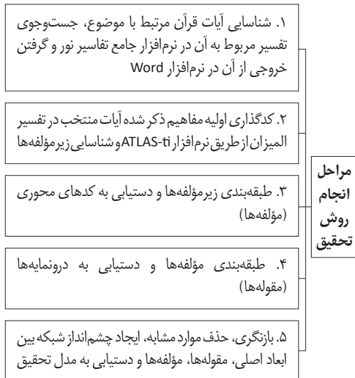
شکل ۴. مراحل انجام روش تحقیق پژوهش.

مفاهیم استخراج شده از تفسیر میزان در ارتباط با موضوع پژوهش، دارای ۵ مقوله، ۱۴ مؤلفه و ۱۰۷ زیرمؤلفه به شرح مندرج در جدول ۱ است. نشانگر موجود در جدول، شامل یک عدد ۱۱ رقمی است که سه عدد نخست آن بیانگر شماره سوره، سه عدد دوم شماره آیه، دو رقم بعدی شماره جلد تفسیر میزان و سه رقم انتهایی شماره صفحه تفسیر میزان است. در ادامه هر یک از مقوله‌ها به‌تفصیل توضیح داده می‌شود.