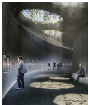
تصویر ۳. ورودی وادی ناسوت.