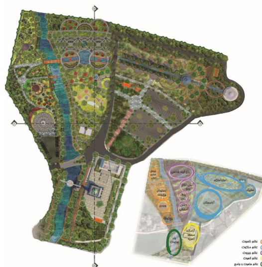
تصویر ۲. سایت پلان باغ ملکوت - جانمایی فضاها.

وادی ناسوت به مثابه بازتابی از عالم فلک یا جهان مادی و جسمانی است که دربرگیرنده عملکردهای تفریحی، رفاهی و خدماتی است (جدول‌های ۵ و ۶)؛ چراکه عالم ناسوت ذاتاً و فعلاً مادی است. در قسمت ورودی، نقطه عطفی برای این مرحله در نظر گرفته شده است که شرح حال فضای کلی وادی