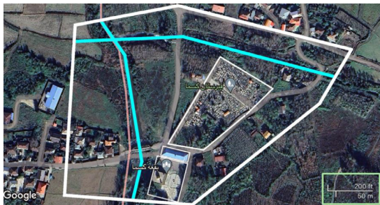
تصویر ۱. عکس هوایی از سایت انتخابی؛ نقاط شاخص سایت: ۱. آرامستان، ۲. مسجد، ۳. بقعه کسما.

همچنین ساماندهی آرامستان مجموعه با هدف تأمین نیازهای روحی و روانی بازماندگان افزوده است و بستر مناسبی جهت ایجاد محیطی امن و ارزشمند در قالب باغ ملکوت فراهم کرده است. (تصویر ۱)