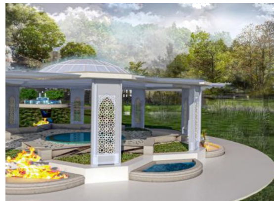
تصویر ۴. نقطه عطف وادی ملکوت.