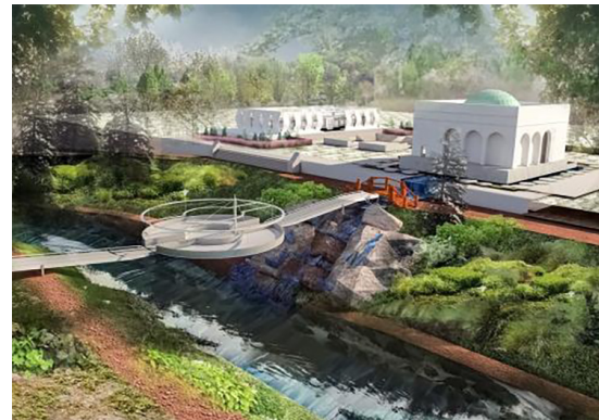
تصویر ۷. وادی لاهوت، هاهوت و جامع.

وادی هاهوت به مثابه بازتابی از عالم ذات یا همان مرحله غیب‌الغیوب است که در آخر به وادی جامع و یا همان خروجی مجموعه منتهی می‌شود و این سیر تکاملی را به یک چرخه بدل خواهد کرد؛ وادی هاهوت به وادی جامع یا انسان کامل (همان نقطه آغازین) متصل می‌شود و شروع و پایان مجموعه را به یک گره مبدل می‌سازد (جدول ۵). در این نقطه انسان با عبور و طی کردن مسیر رودخانه دل را به دریای معرفت زده و با ذرات خروشان آب همراه و جاودانه خواهد شد و به همان باغ جان که جامع جمیع مراتب وجود است نائل می‌شود (تصویرهای ۶ و ۷).