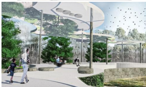
تصویر ۵. آمفی‌تئاتر، نقطه عطف وادی جبروت (باغ تصویری است در آب و درخت نمادی است از ذات الهی).