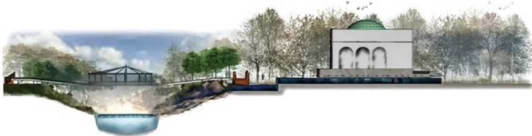
تصویر ۶ مقطع وادی لاهوت، هاهوت و جامع.